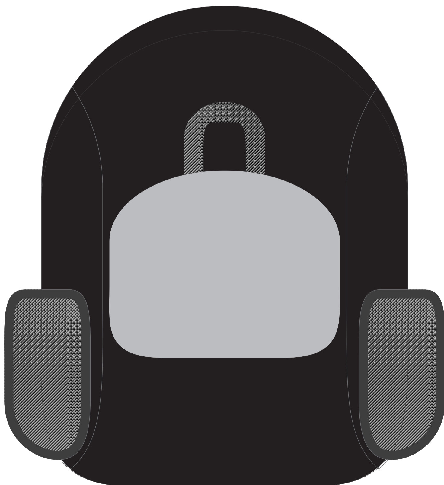
Рюкзак, свернутый в чехол, сторона 1, светоотражающая

* двойная припрессовка по 10 секунд, t° 150 С°